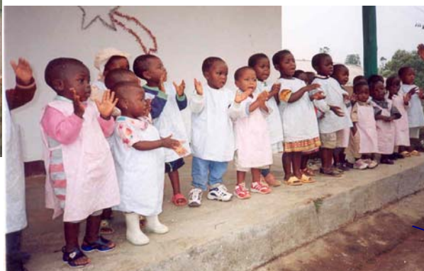
Bambini dell'asilo di Fonjumentaw